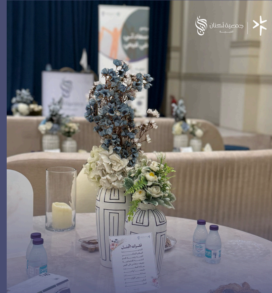
حفل معايدة الأسر السنوي بمناسبة عيد الفطر المبارك لعام ٢٠٢٥