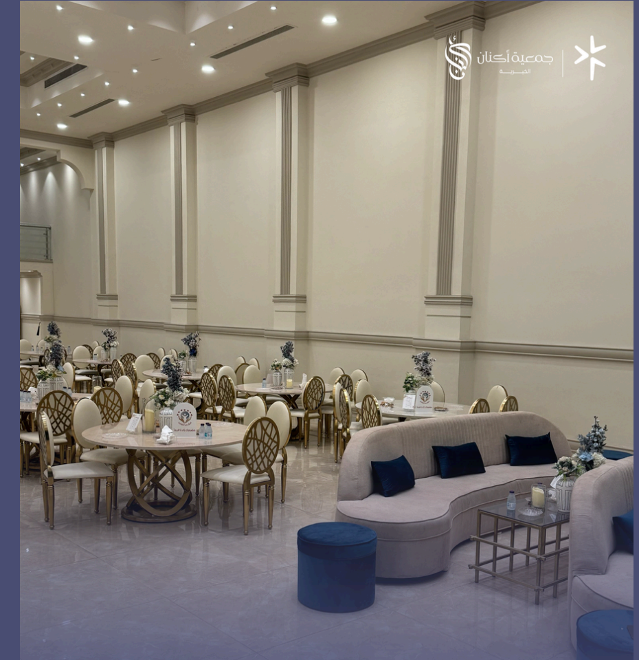
حفل معايدة الأسر السنوي بمناسبة عيد الفطر المبارك لعام ٢٠٢٥