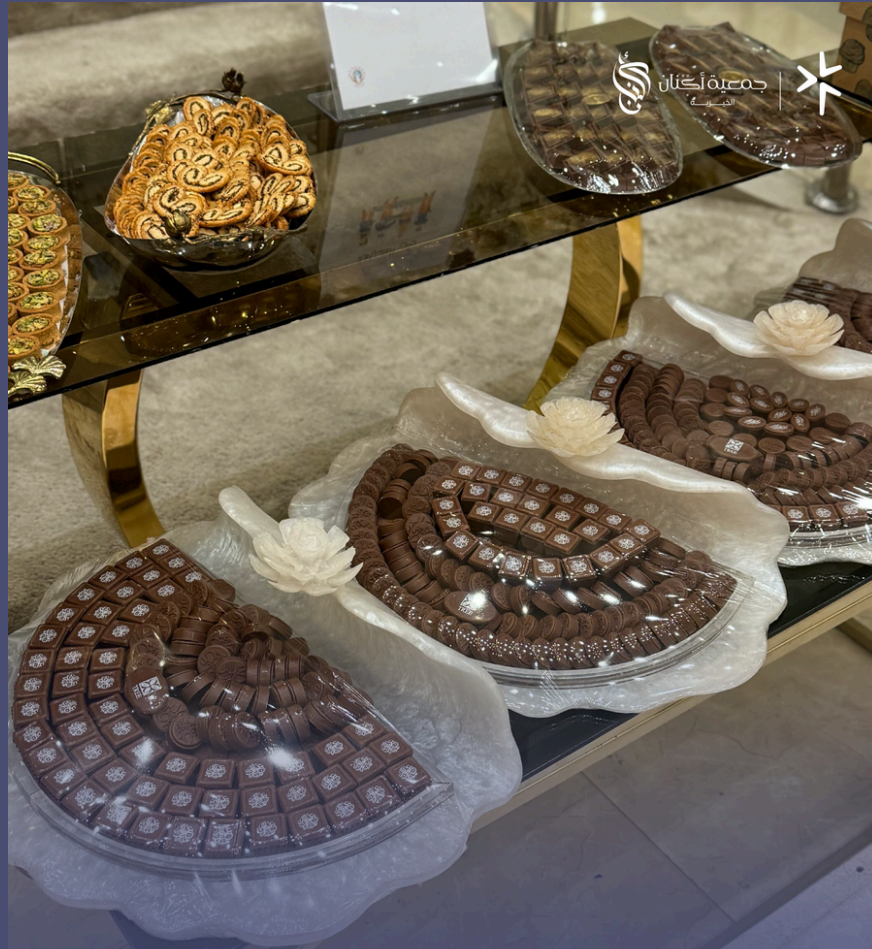
حفل معايدة الأسر السنوي بمناسبة عيد الفطر المبارك لعام ٢٠٢٥