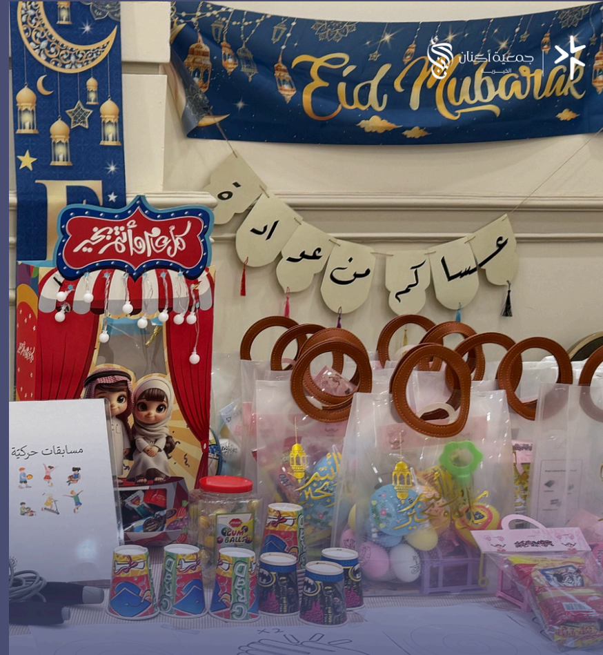
حفل معايدة الأسر السنوي بمناسبة عيد الفطر المبارك لعام ٢٠٢٥