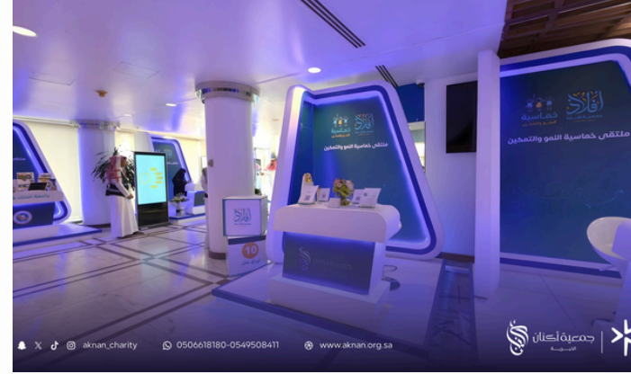
مشاركة الجمعية في ملتقى خماسية النمو والتمكين أقامته جمعة أفلاذ