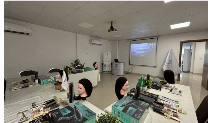
إقامة دورتي تصفيف الشعر وأساسيات المكياج ضمن مشروع تمكيني مع أكنان