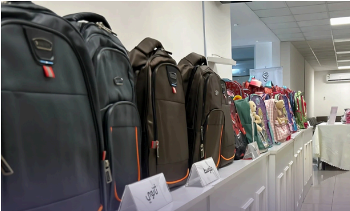
مشروع الحقبة المدرسية