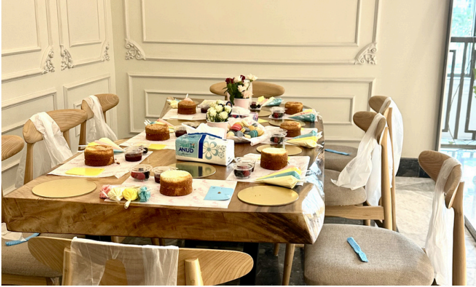
ورشة "تزيين الكيك للأطفال" ضمن مشروع ألوان بالتعاون مع بيلا سويت