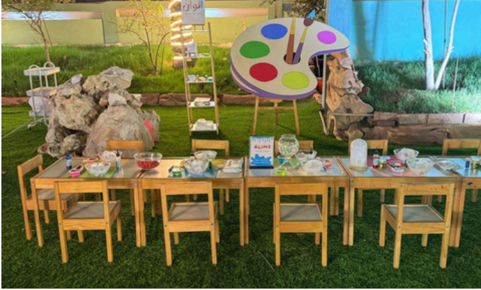
أحد الحجوزات لمشروع ( ألوان لتنسيق حفلات الأطفال )