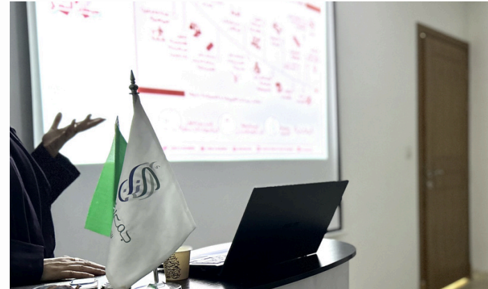
تفعيل حملة سرطان الثدي بحضور الأسر ومنسوبي الجمعية