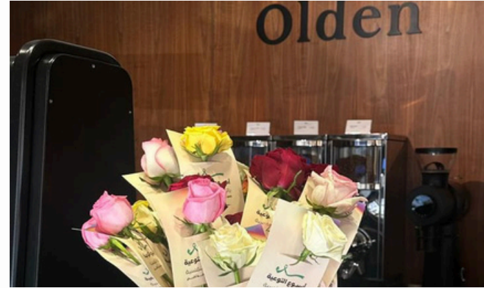
تفعيل أسبوع الصحة النفسية ضمن مبادرة سحابة أكنان بالتعاون مع عدة مقاهي