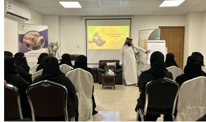
جانب من برنامج سعادي في قيمي