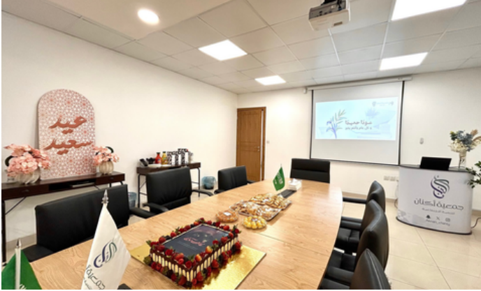
معايدة لموظفات الجمعية