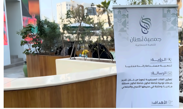
تفعيل مبادرة "سحابة أكتان" الخيرية بالشراكة مع مطعم باركرز الخبر