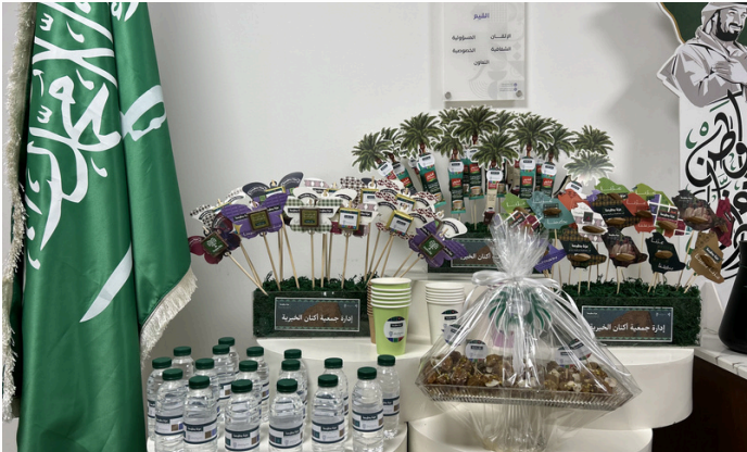
تفعيل اليوم الوطني السعودي 90