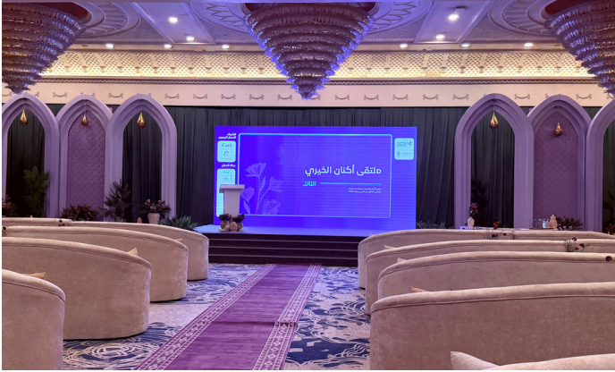
إقامة ملتقى أكنان الخيري الثالث