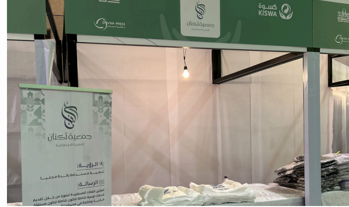
توزيع كسوة العيد للمستفيدين بالتعاون مع مشروع كسوة في سوق كسوة الخيري