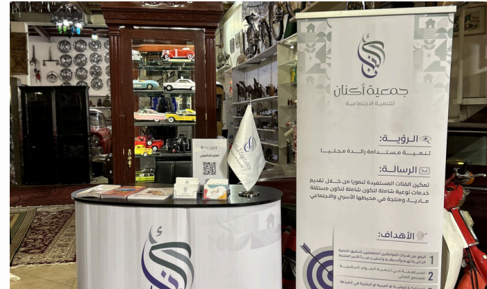
مشاركة الجمعية في معرض فوانيس الخامس بركن تعريفية