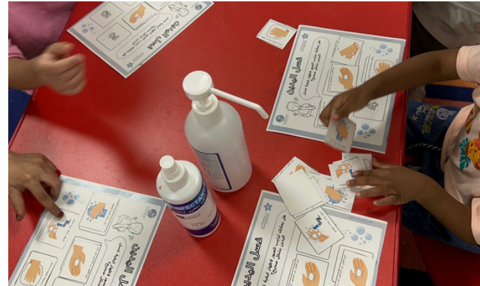
برنامج مسرة أطفال أكتان