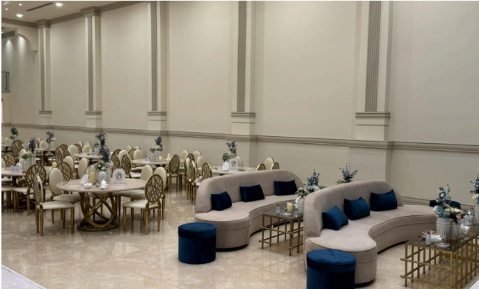
حفل معايدة الأسر احتفاءً بعيد الفطر المبارك 2025