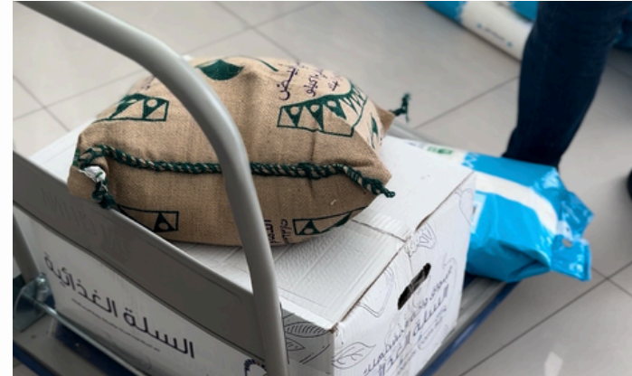
توزيع السلال الغذائية لمستفيدي الجمعية في شهر رمضان المبارك