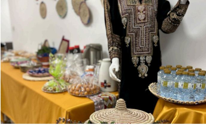
تفعيل يوم التأسيس السعودي لأسر الجمعية