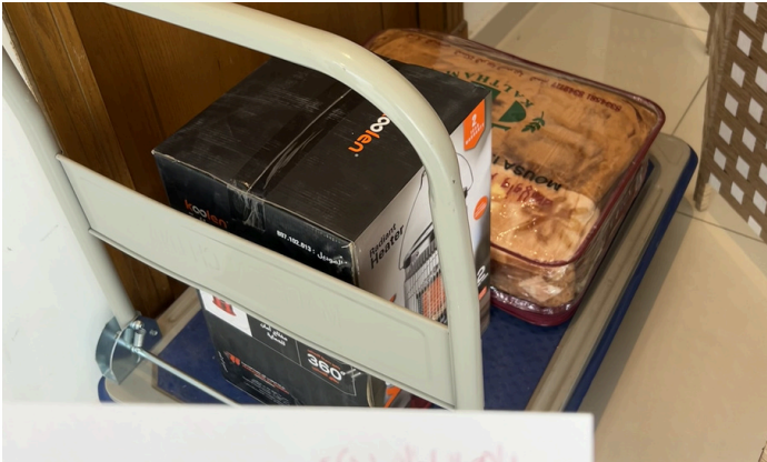
مشروع كسوة الشتاء تم خلاله توزيع بطانيات ودفايات وكوبونات مشتريات