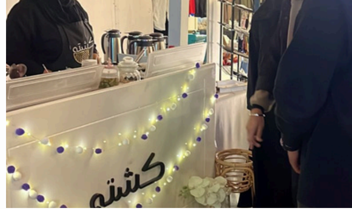
مشاركة عربة كشته في معرض ملفا