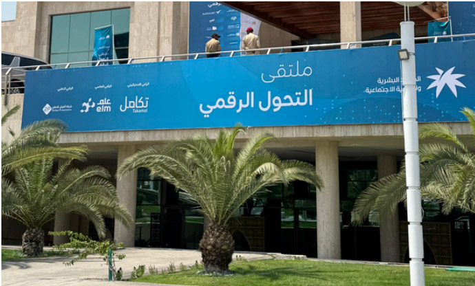
حضور ملتقى التحول الرقمي النسخة الرابعة