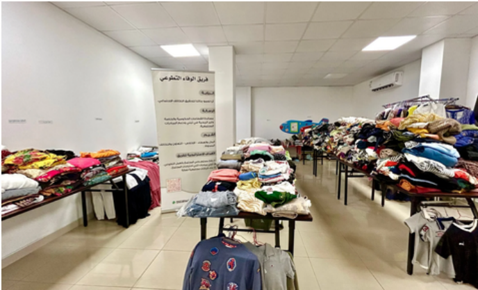
فريق الوفاء التطوعي يقدم كسوة العيد للمستفيدين ضمن مبادرة عطاء العيد