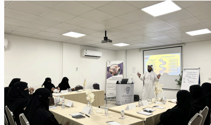
دورة تدريبية للأخصائيات الاجتماعيات وعضوات القسم لتنمية المهارات